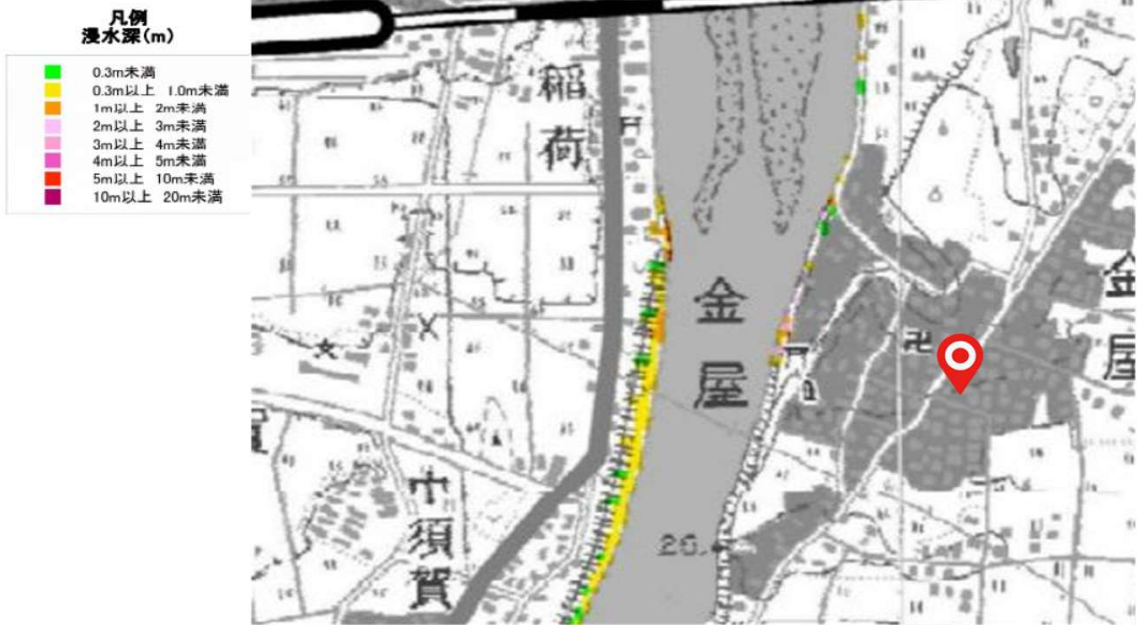
大分県津波浸水想定 市町村別 宇佐市